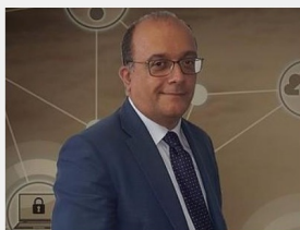
(Foto: Ianni Michele, Coordinatore del Comitato Scientifico di Federprivacy)