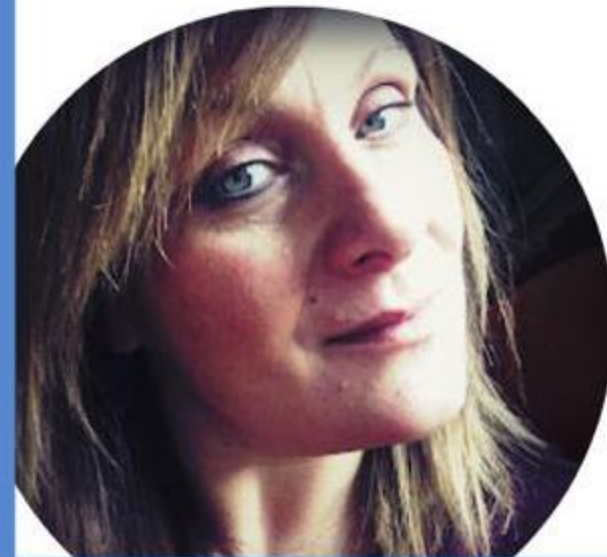
NADIA TAVELLA SCUOLA SECONDARIA DI PRIMO GRADO

Il nostro scopo come lista sarà quello di portare una fotografia attendibile della realtà, e rappresentare al meglio tutto il comparto scuola. Bisogna ridare dignità alla figura docente perchè siamo i primi agenti di inclusione sociale ed educativa.